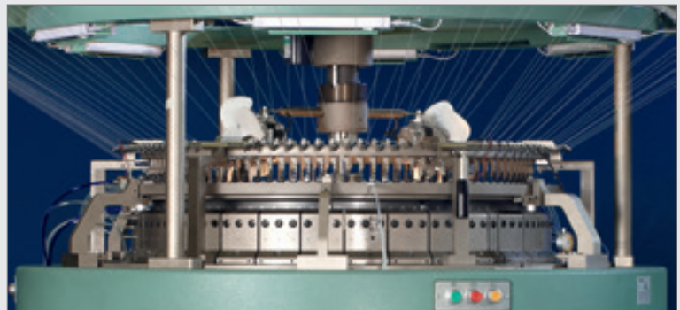
编织部份（三路三角座）