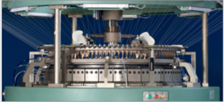
Örgü başı (3-besleme Çelik kutusu)