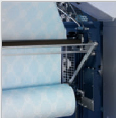
UCC572M – Warenabzug