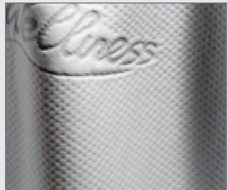
UCC572M – Musterbeispiel

Vorderseite: Maschinenmodell UCC572M Technische Änderungen vorbehalten. Abbildungen können Zubehör zeigen, welches in der Standardausstattung nicht enthalten ist. Stand 06/2010