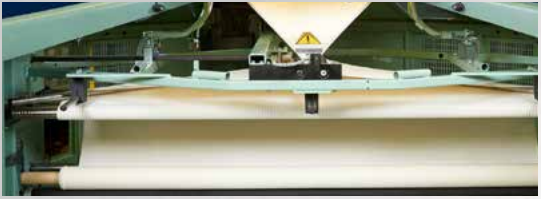
Yeni ve Verimli Açık En Alt Çekirme Sistemi