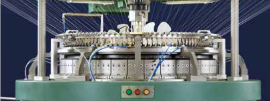
Örgü Başı (3-besleme çelik kutusu)